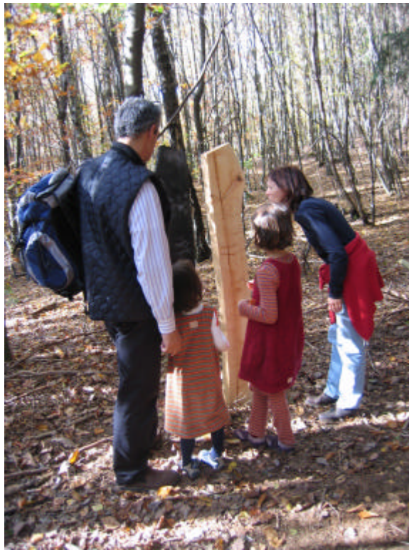
Stelenpaar „Vegetatis & Mineralis“ von Lothar Wilhelm